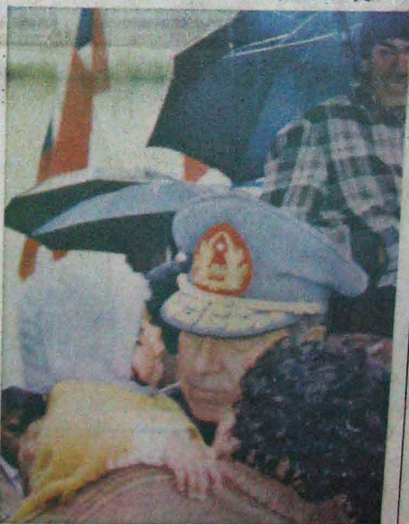
EXPRESION DE AFECTO.— El Presidente Augusto Pinochet saluda cariñosamente a un niño durante la ceremonia de inauguración de una población de 135 casas construidas por la Fundación Cema-Chile, en la comuna de Pudahuel. Las viviendas, de madera de pino, cuentan con gran parte del equipamiento doméstico. Posteriormente, el jefe del Estado visitó un centro abierto diario, que otorga asistencia a 1.300 jóvenes con problemas, a quienes se les brinda educación especializada. (Información en página C 11)