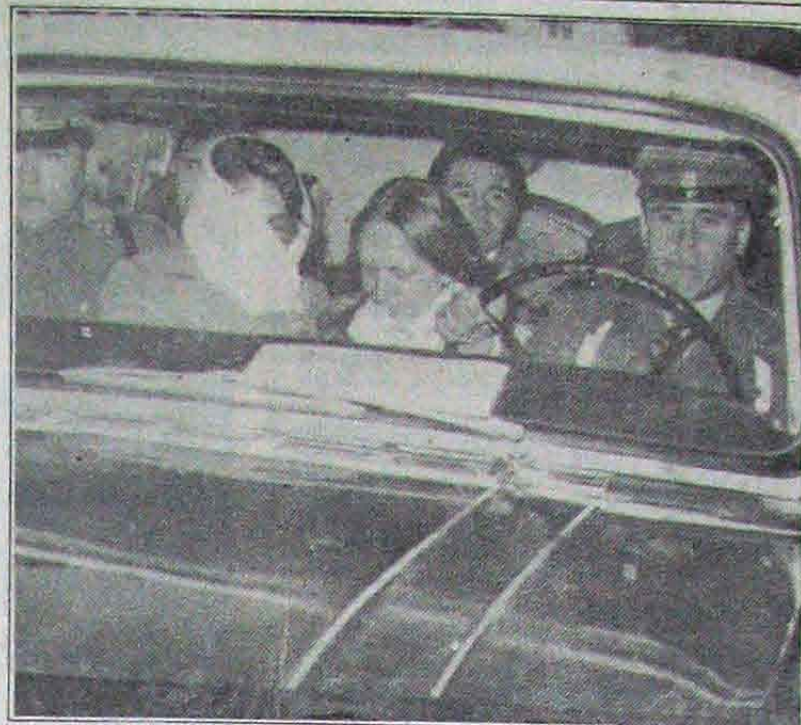
DOLOR DE FAMILIARES.— Parientes de uno de los dos ejecutados, visiblemente conmovidos y llorando, aparecen en el interior de un furgón, horas después de haberse efectuado el doble fusilamiento. El vehículo formó parte del cortejo, encabezado por un carro mortuario, en el que se trasladaron a la ciudad de Arica los cadáveres.