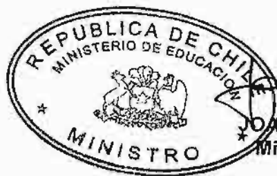
JOAQUÍN LAVÍN INFANTE Ministro de Educación