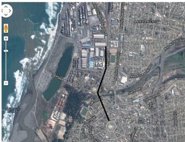
MEJORAMIENTO CIRCUITO PORTALES – O'HIGGINS, SAN ANTONIO®, 2° LLAMADO ILUSTRE MUNICIPALIDAD DE SAN ANTONIO DIRECCIÓN DE OBRAS MUNICIPALES