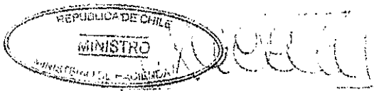
FELIPE LARRAÍN BASCUÑAN Ministro de Hacienda